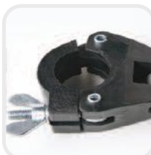
Acoplador de nailon