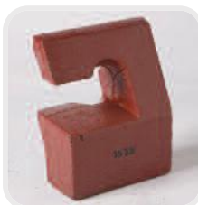
Peso de lastre