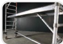
Plataforma de franqueo vertical