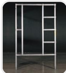
Bastidor de paso a través

Existe una amplia gama de componentes y accesorios disponibles para los sistemas de torre de acceso Span ofreciendo la máxima versatilidad.